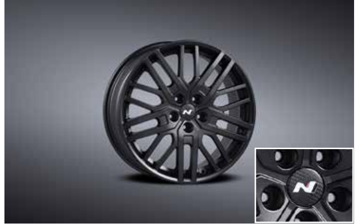
19인치 블랙 경량 휠 & 리얼 카본 휠캡