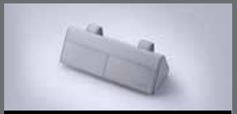
선바이저 선글라스 키스