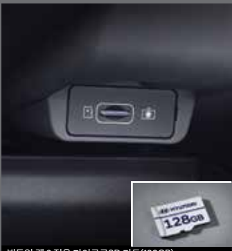
빌트인 캠 2 전용 마이크로SD 카드(128GB)