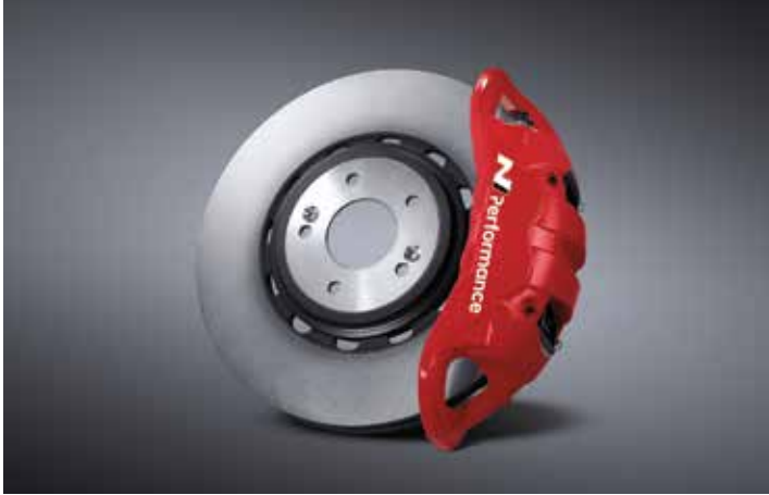
모노블록 4P 캘리퍼 & 하이브리드 디스크 & 로우 스틸 패드