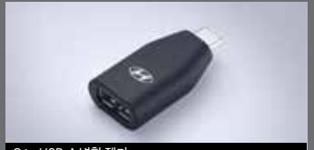
C to USB-A 변환 젠더