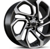
19인치 카빈 메쉬드 알로이 휠 (RS)