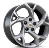
17인치 브라이트 실버 알로이 휠 (LT)