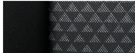
블랙 폼비 시트 (직물 및 인조가죽 적용) [LT]