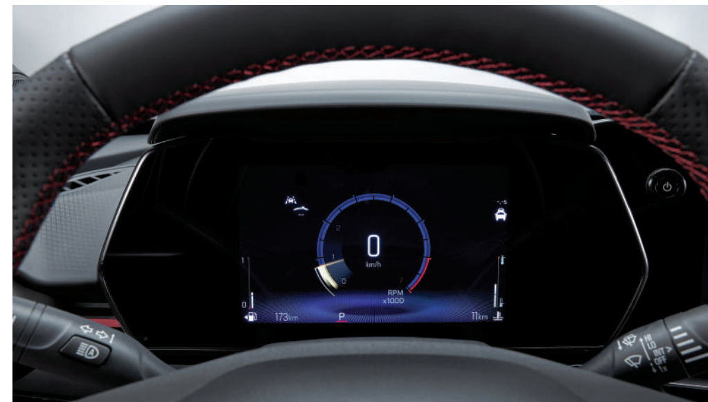
8인치 컬러 클러스터 무선 충전 시스템

스마트폰 무선 폰 프로젝션과 무선 충전 시스템으로 선이 없는 자유로움을 즐길 수 있습니다.