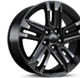
18인치 글로스 블랙 알로이 휠 (ACTIV)