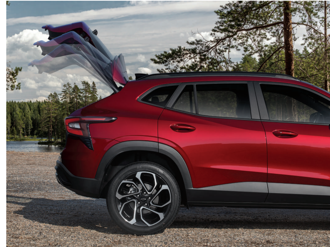
파워 리프트게이트 오토 홀드 (Auto hold)