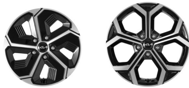
16인치 전면가공 휠