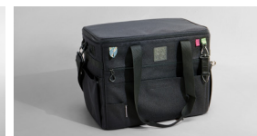
캠핑용 수납 가방