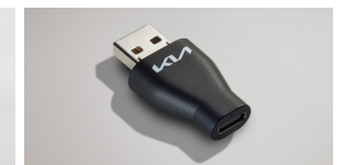
A to USB-C 변환 젠더*