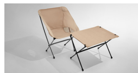
캠핑 의자 & 테이블